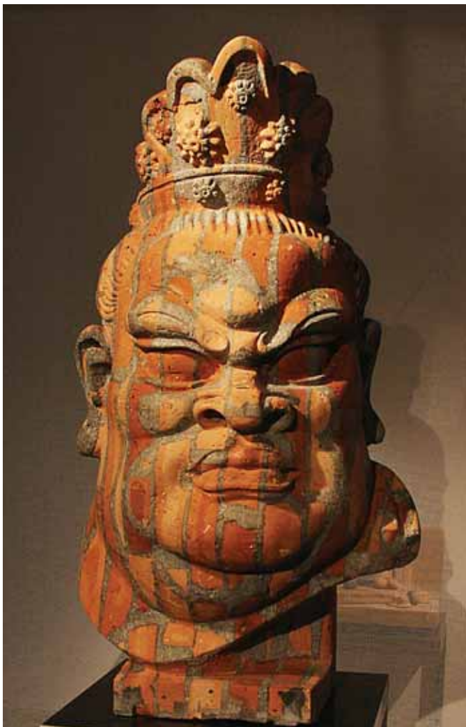
04 温故知新 摹本 菩萨像 唐大明宫出土 05 摹本 山西双林寺金刚头像 元末明初